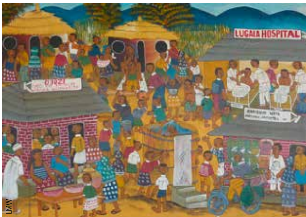
Die Gesundheitsversorgung ist – neben Bildung und Verkündigung – eine der drei „klassischen“ Säulen der Missionsarbeit.

Evangelistenausbildung in Oldonyo Sambu zu entsenden. Nach vielerlei unerwarteten Schwierigkeiten bei Genehmigungen und ähnlichem erfolgte am 23. April 2017 endlich die Ausreise. Die Besetzung der Stelle einer Lehrschwester in der an das Hospital angeschlossenen Schwesternschule in Lugala steht noch aus, nachdem zwei Bewerberinnen ihre Bewer-