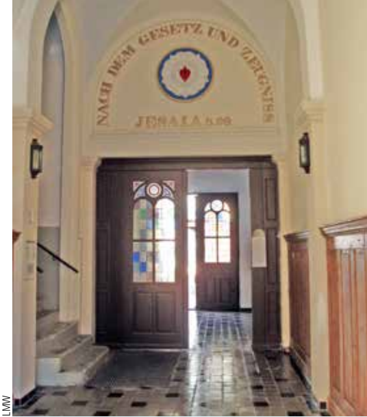
Im März 2017 ging die Genehmigung für den Einbau eines innenliegenden Aufzugs (links neben der Treppe) ein.

Weitere Zuweisungen für Baumaßnahmen zur barrierefreien Erschließung des Misionshauses von den Trägerkirchen konnten in Höhe von 200.000 Euro akquiriert werden.