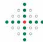
Evangelisch-Lutherische Landeskirche Sachsens