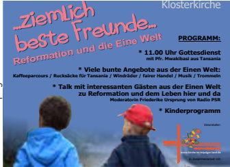
Kirchenbezirk Leipziger Land