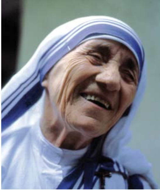
Mutter Teresa folgte dem Beispiel des barmherzigen Samariters und kümmerte sich um die Armen im indischen Kalkutta.

reicht zu seiner Beschreibung aus. Dem Beispiel des barmherzigen Samariters sind viele Christen gefolgt, denken wir nur an Mutter Teresa von Kalkutta, Henri Dunant, den Gründer des Internationalen Roten Kreuzes, und an Albert Schweitzer, den Missionsarzt, Philosoph und Friedensnobelpreisträger, der die „Ehrfurcht vor dem Leben“ lebte und lehrte.