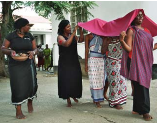
Als Technik der Aufklärung über die Folgen der weiblichen Genitalverstümmelung werden Theaterstücke, Gesang und Tanz eingesetzt.

Wieder andere Gemeinden, zum Beispiel Tindigani in der Nähe des Kilimanjaro Airport werden beim Schulbau und bei der Versorgung mit Trinkwasser unterstützt, um die hygienischen Verhältnisse zu