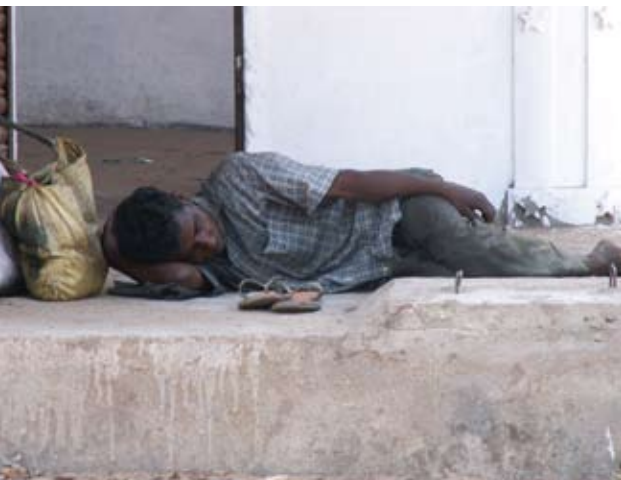
Dalits stehen außerhalb des indischen Kastensystems und damit am Rande der Gesellschaft. Nur wenige lehnen sich dagegen auf.

niert und weiter unten man sich in der Hierarchie befindet. So sind Heiraten oder gemeinsame Mahlzeiten von Menschen aus den unterschiedlichen „Sphären“ undenkbar. Ebenso schwierig ist die Nutzung derselben Wasserquelle oder der Eintritt eines „Unreinen“ in das Haus eines „Reinen“. Auch viele andere soziale Interaktionen sind tabu; die „Unreinen“ werden sozial und örtlich segregiert, geächtet und diskriminiert. Ein klarer Verstoß gegen elementare Menschenrechte – aber weit verbreitet in Indien!