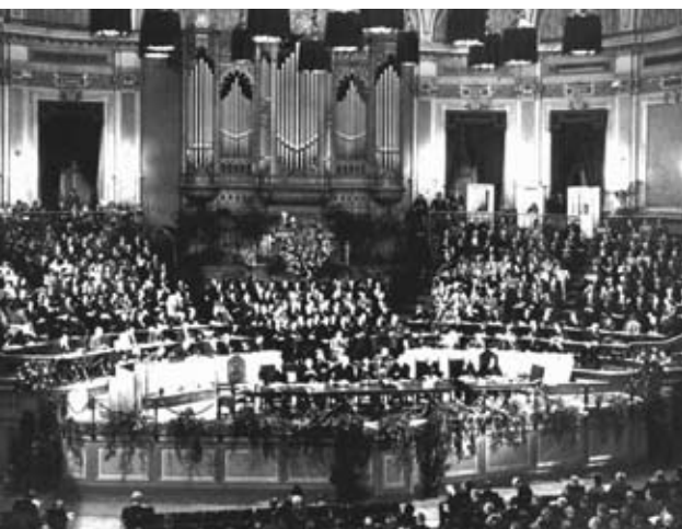
Der Ökumenische Rat der Kirchen proklamierte bei seiner Gründung 1948 das Konzept der „verantwortlichen Gesellschaft“.

grundlegende Rechte verweigerten, in der Euthanasie „lebens-unwertes Leben“ vernichteten und selbst vor organisiertem Völkermord nicht zurückschreckten. Wer immer gegen solche Unmenschlichkeit protestiert, geht in seinem ethischen Urteil davon aus, dass grundlegende Rechte dieser Verfolgten nicht von der Mehrheitsentscheidung einer Gesellschaft abhängig gemacht werden können.