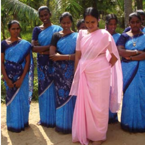
Auch Frauen aus Mayiladuthurai reisten nach Porayar.

Indien ist immer öfter Schauplatz für Bombenanschläge. In Ahmedabad und Bangalore kamen im Juli mindestens 46 Menschen ums Leben. Eine kleine Gruppe namens „Indische Mudschahedin“ bekannte sich zu den Anschlägen. In einer E-Mail an verschiedene Fernsehsender kündigte die Gruppierung „Rache für Gujarat“ an – offenbar eine Anspielung auf schwere Unruhen zwischen Hindus und der muslimischen Minderheit 2002. Damals wurden 1.000 Menschen getötet, die meisten von ihnen waren Muslime. Auslöser der Gewalt war ein Brand, der 60 Passagiere eines mit Hindu-Pilgern besetzten Zugs das Leben kostete.