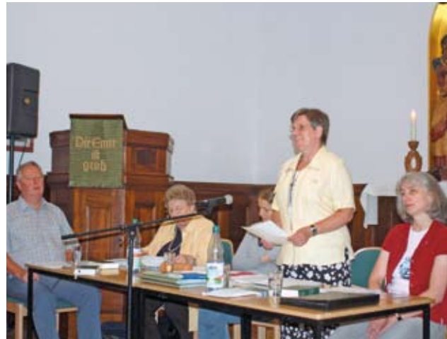
Die Mitglieder des Freundes- und Förderkreises treffen sich zum Jahresfest, bei dem der Vorstand seinen Tätigkeitsbericht vorlegt.

kreis vorbereitet. Nach dem Missionssonntag im Kirchenbezirk Leisnig-Oschatz 2007 werden wir am 14. Juni 2009 im Kirchenbezirk Zwickau zu Gast sein. Ziel