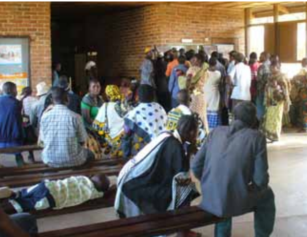
Im Aufnahme-Raum des Lugala-Hospitals warten die Patienten. Manche waren vorher tagelang zu Fuß oder mit dem Fahrrad unterwegs.

Verantwortung beinhaltet das Wort „Antwort“. Antworten kann man nur, wenn man gerufen wird. Vielleicht sind wir gerufen worden? Vielleicht ist es das, das uns hier leben und arbeiten lässt? ■