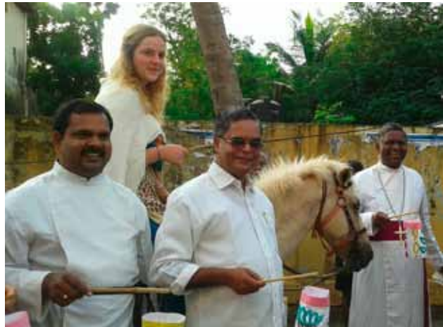
Zur Eröffnung der Adventsaktion fand der erste Martinsumzug in der Geschichte der Tamilischen Evangelisch-Lutherischen Kirche statt.