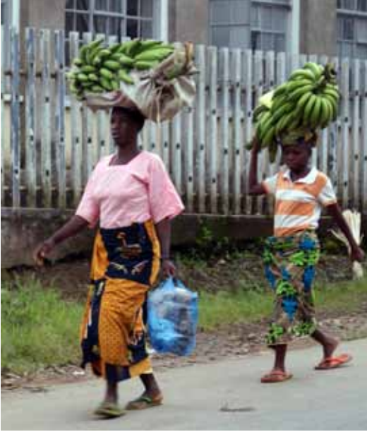
Frauen tragen schwere Lasten – im buchstäblichen und übertragenen Sinn. Trotzdem wird erwartet, dass sie sich unterordnen.

rungsfreien Haltung gegenüber Frauen zu sensibilisieren. Nur durch Erziehung und Bildung kann es gelingen, dass die Gleichberechtigung der Frau sich auch in Erbschaftsangelegenheiten flächendeckend durchsetzen wird.