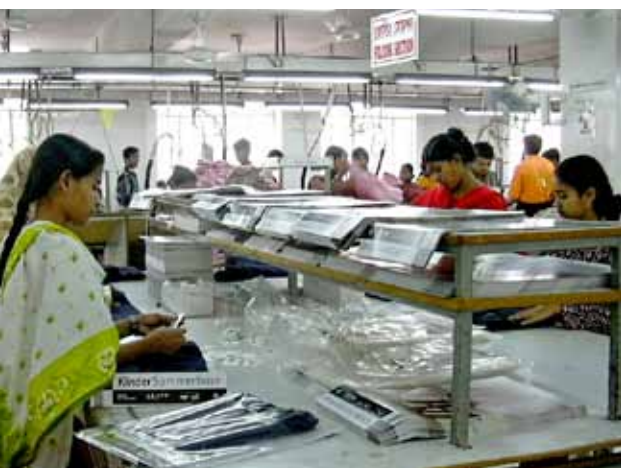
In Dhaka, Bangladesch, werden Textilien für den deutschen Markt gepackt. Die Frauen stehen oft länger als zehn Stunden am Tag.

Gerechtigkeit in der Arbeit der Mission bedeutet, von der ersten Begegnung an sensibel aufeinander zu hören. Gerechtigkeit kann somit nicht nur als