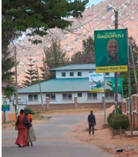
Neuer Präsident Tansanias ist John Magufuli. Er gehört zur CCM, der ehemals sozialistischen „Partei der Revolution“.

Mit Hilfe des Koordinierungsgremiums „Lutheran Mission Cooperation“ (LMC) gestaltet die Evangelisch-Lutherische Kirche in Tansania (ELCT) ihre Zusammenarbeit mit unseren Trägerkirchen über das LMW. Mit Hilfe auch unserer Zuschüsse werden die prioritären Kernprogramme der 24 Diözesen und dem Hauptbüro in Arusha in den Bereichen Mission und Evangelisation, Sozialarbeit und Diakonie sowie allgemeine Stipendienprogramme und speziell auch Stipendien für die theologische Aus- und Fortbildung unterstützt. Im Oktober 2015 fand die LMC-Sitzung in Bukoba statt und stand unter