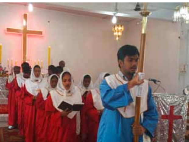
Die Tamilische Evangelisch-Lutherische Kirche (TELC) ist eine Dalit-Kirche. Und doch gibt es auch viele kritische Fragen an sie.

Nach Statistiken des Amtes für die Registrierung von Straftaten in Indien werden durchschnittlich jede Stunde zwei Dalits angegriffen, jeden Tag drei Dalit-Frauen vergewaltigt und zwei Dalits ermordet. Die renommierte Tageszeitung Times of India hat 2014 konstatiert, dass Übergriffe gegenüber Dalits in den letzten 10 Jahren um 245 Prozent zugenommen haben.