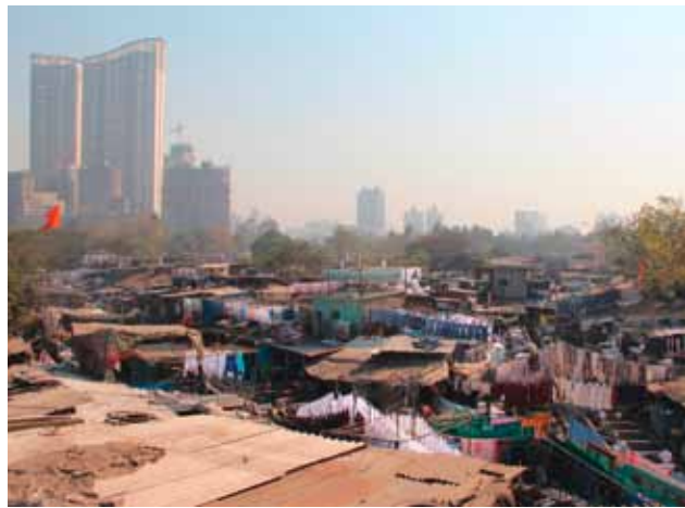
In Städten – wie hier im indischen Mumbai – liegen Reichtum und Armut oft sehr nah beieinander.